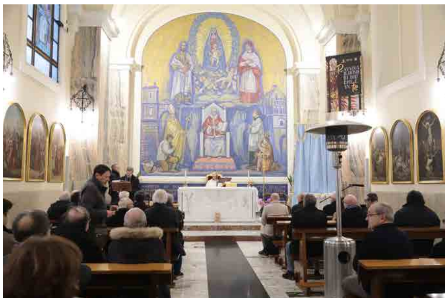
La S. Messa nella monumentale Cappella del Seminario