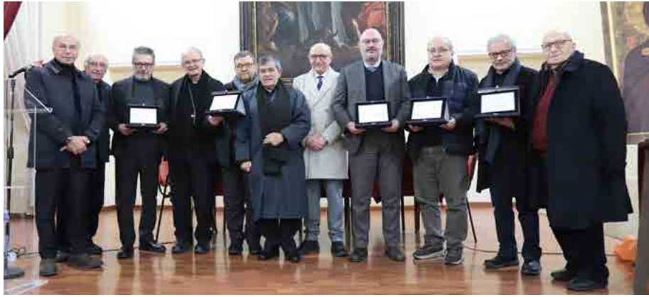
I premiati con il Vescovo, il Sindaco e le altre Autorità