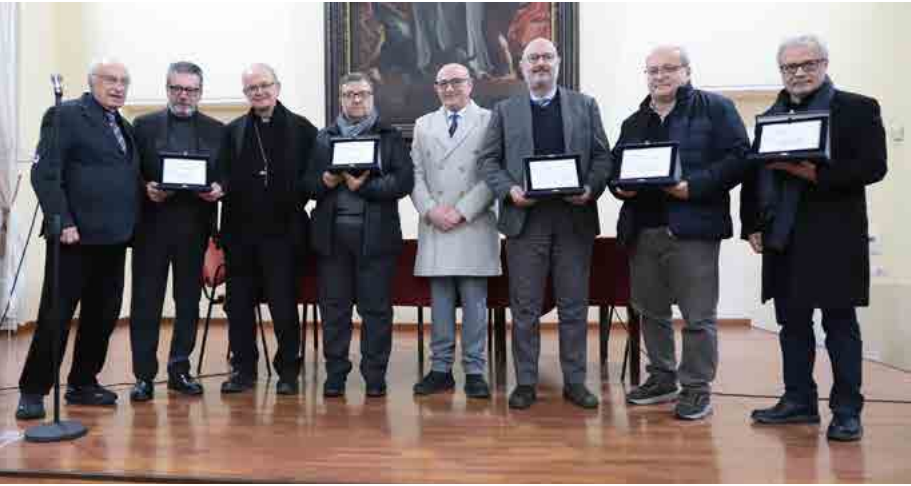
Il gruppo dei premiati con il Vescovo e il Sindaco

state annunciate da Luigi Ferraiuolo, segretario generale del Premio, con due cerimonie nella abituale cornice della Biblioteca della Curia di Caserta, il 14 febbraio con la consegna dei riconoscimenti, e il 16 per la proiezione del docufilm del Centro Televisivo Vaticano ispirato a Papa Leone XIV che verrà presentato in anteprima in cinque città italiane tra cui Caserta.