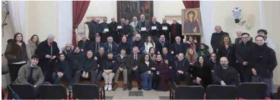
Il gruppo dei premiati con i giornalisti e le Autorità

sano, redattore del Corriere del Mezzogiorno e del Corriere della Sera, un passato di esperienze da direttore in radio, televisione, web e stampa periodica, autore del libro "Sabbia-Afghani-