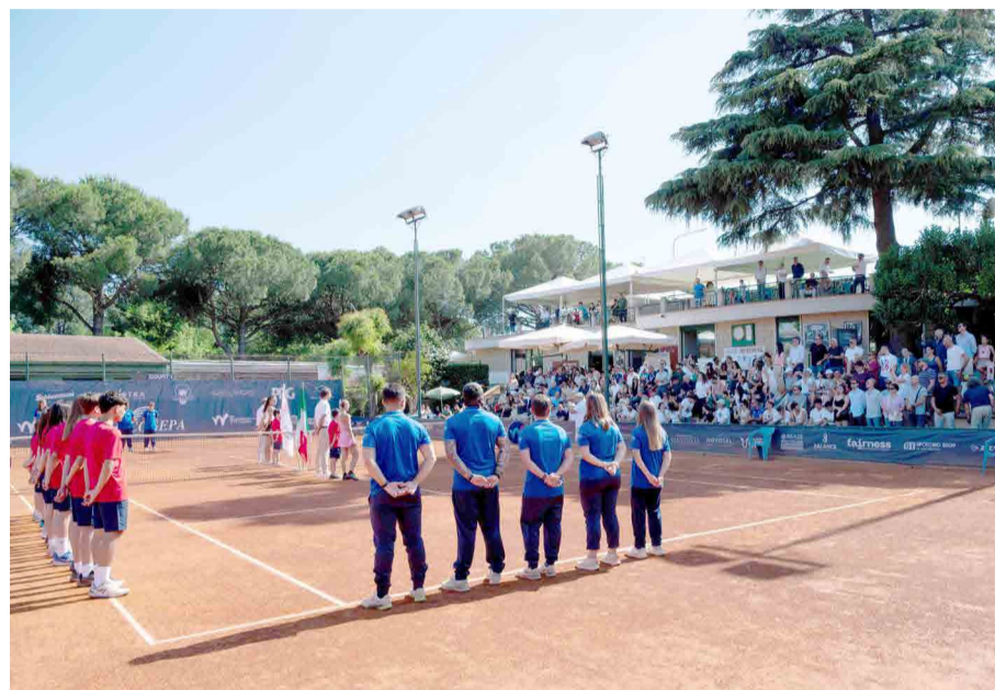
CERIMONIA DI APERTURA