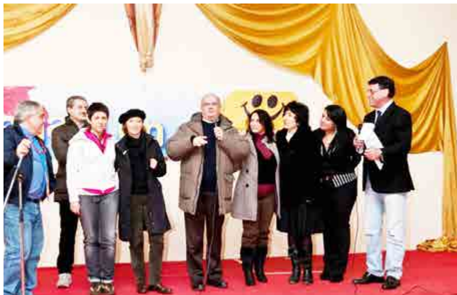
NELLE FOTO, UNA DELLE PRIME EDIZIONI DI REGALA UN SORRISO, CHE SI SVOLGEVA ALLA ROTONDA DI SAN NICOLA LA STRADA, CON L'ALLESTIMENTO ANCHE DI UNO SPETTACOLO.