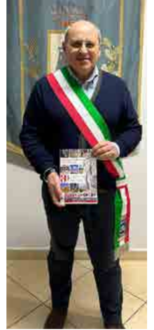
Il sindaco di Recale Raffaele Porfidia