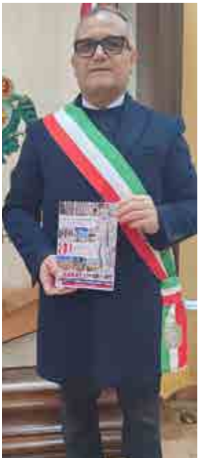
Il Sindaco di San Prisco Domenico D'Angelo