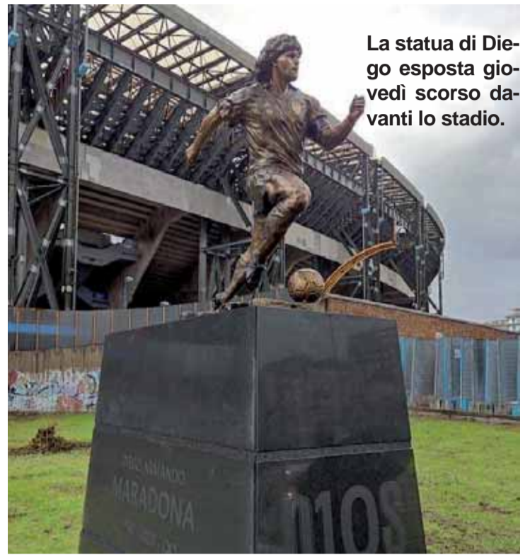
La statua di Diego esposta giovedì scorso davanti lo stadio.

Nella ripresa sono ancora i nerazzurri a partire forte con Lautaro che subito costringe