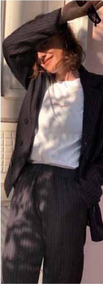
Sabato sera, ad Aversa, al Civico 103, Artgallery, è stato presentato "In fondo per tutti è così" primo